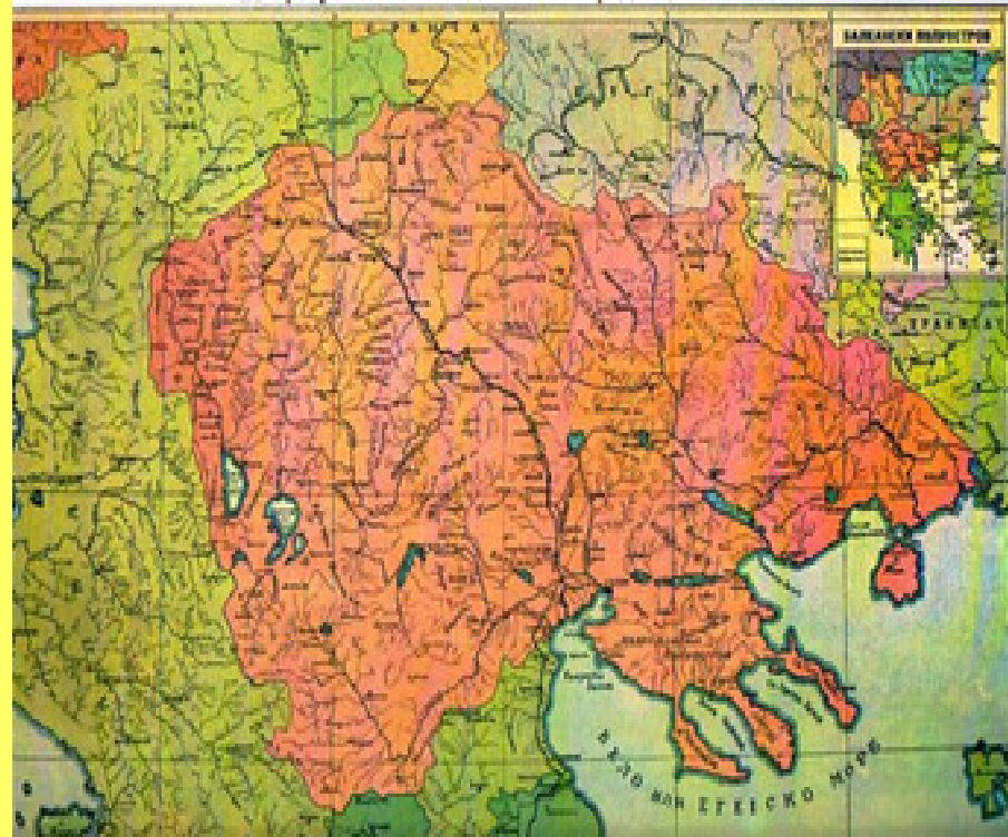
Етничка карта на Македонија