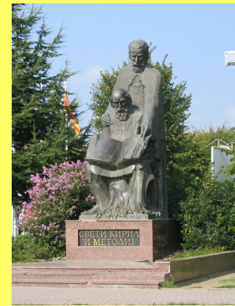
Кирил и Методија. Споменик.