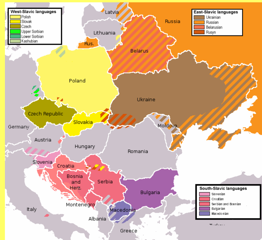
Јазична карта на Словенските јазици