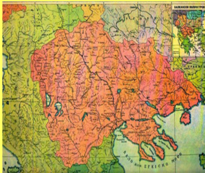
Етничка карта на Македонија