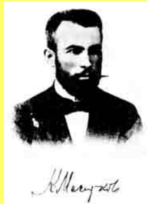
Крсте Петков Мисирков